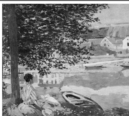
La Seine à Bennecourt Claude Monet, 1868