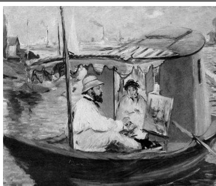
Monet et sa femme sur le bateau atelier Claude Monet, 1874